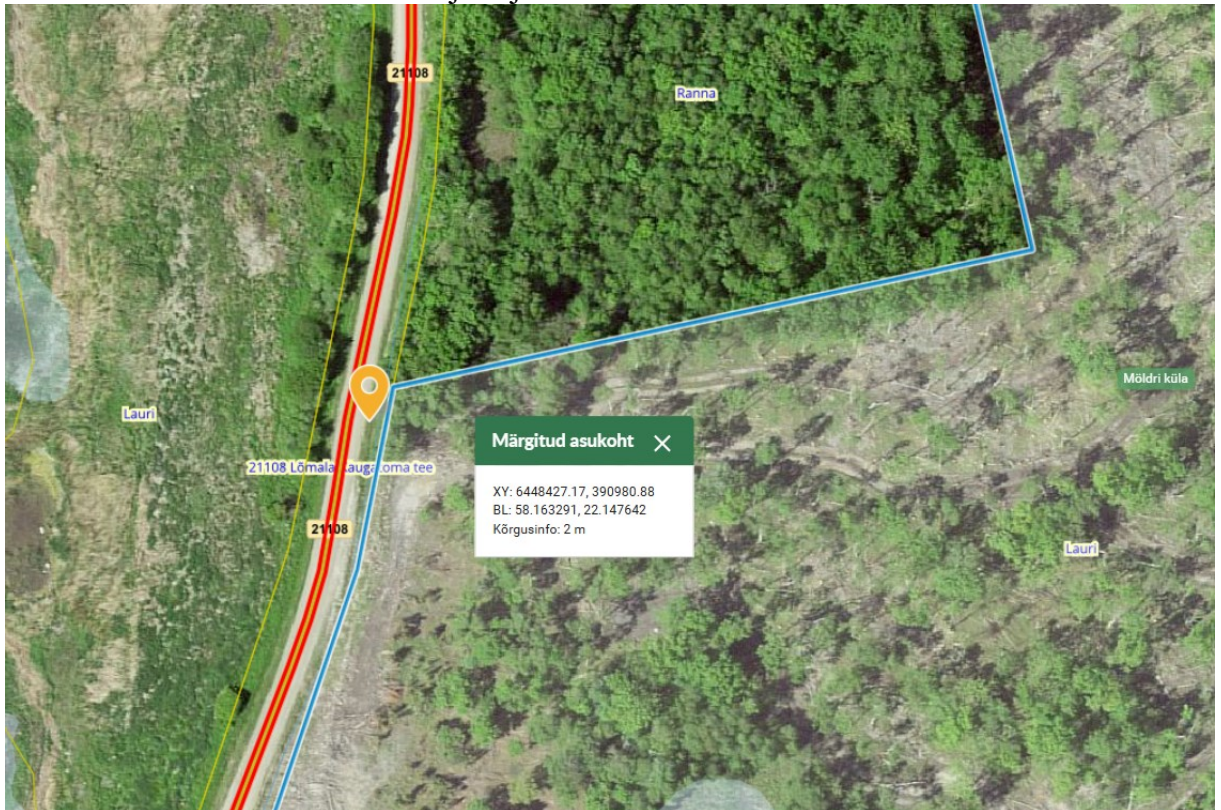
Joonis 1. Ristumiskoha asukoht tähistatud oranži tingmärgiga.